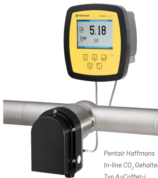
Pentair Haffmans In-line CO 2 Gehaltemeter, Typ AuCoMet-i