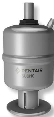
执行器常闭式 NC - 常开式 NO