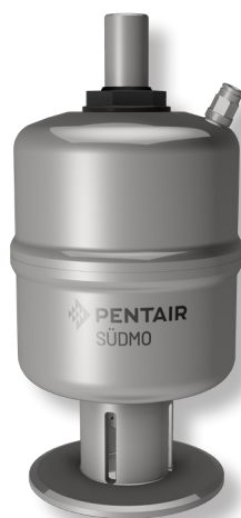
Vérins simple effet NC - NO