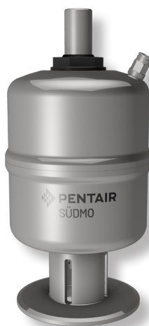
Atuador normalmente fechado NF - normalmente aberto NO